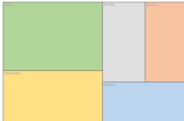
Gambar 2 Hierarchy chart