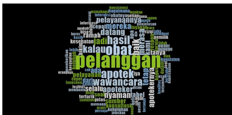
Gambar 1 Word Frequency Query

Validitas data dalam Penelitian ini menggunakan Nvivo dengan hasil sebagai berikut :